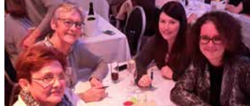
N-VA Hasselt in beeld p.3