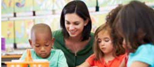
Kinderopvang en onderwijs in Kuringer Heide p.2