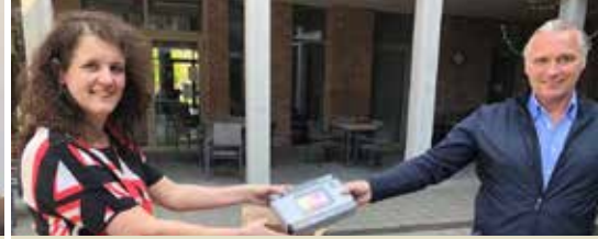
N-VA Hasselt in beeld (p. 3)