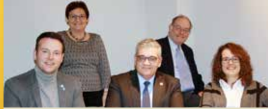
Onze schepenen staan tot uw dienst (p. 2)